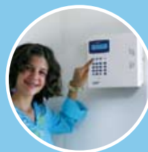
Attraktives Design und einfachste Bedienbarkeit

Neu und exklusiv bei uns: STAR 1000, der Star unter den Alarmanlagen!