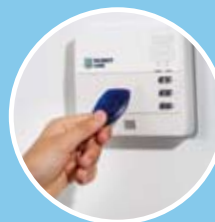
Aktivierung ohne Code mit Komfortbedienteil