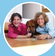
Maximale Sicherheit dank Scuricode™ Technologie