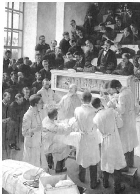
Eine Veränderung brachte auch, als das „niedere Studium“ der Wundärzte an Hürmer Zeitung - Seite 13

SCHULE erlangte durch die Lehrtätigkeit hervorragender Ärzte (Semmelweiß, Billroth, Hyrtl, Böhler u.a.) Weltgeltung. Billroth im Hörsaal, um 1890 Wien