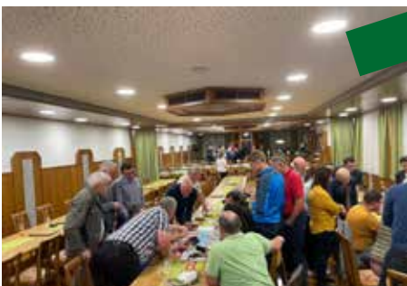
September 2021 Sommergespräche Regenwasserplan