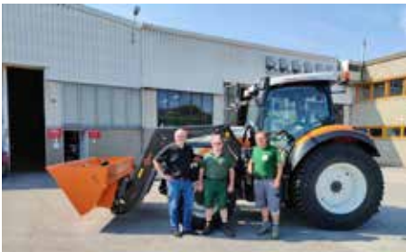
Oktober 2020 neuer Steyr Expert Traktor