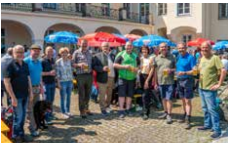
Mai 2023 Tag des Römerweges