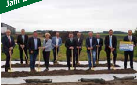
Juni 2020 Spatenstich Straßen- umlegung L5246 Melker Alpenvorland