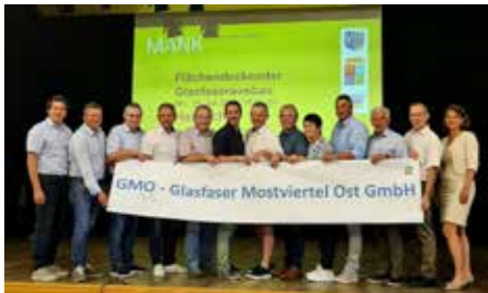
Mai 2023 12 Gemeinden gründen Gesellschaft für flächendeckendes Glasfaser