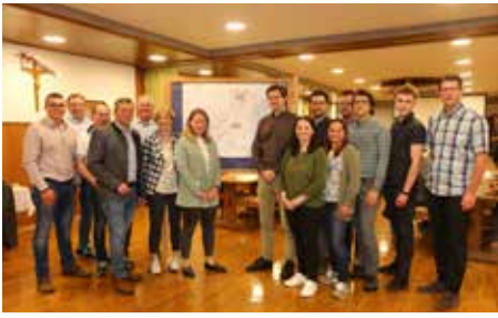
Mai 2022 Ortsgespräche Entwicklungskonzept