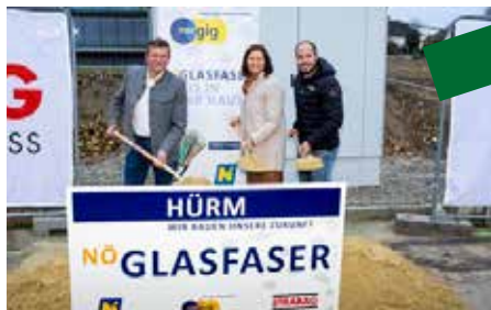
November 2023 Spatenstich Glasfaserausbau