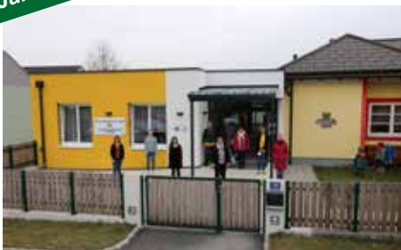
Jänner 2021 40 Jahre Landeskin- dergarten Hürm