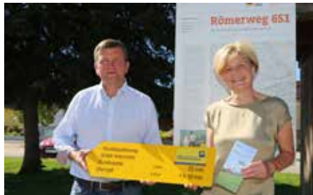
Oktober 2020 Neue Beschilderung Wanderwege Hürm