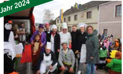
Februar 2024 Faschingsumzug