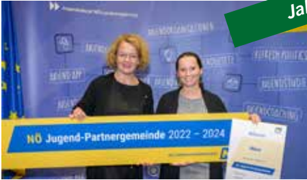
Oktober 2022 Zertifizierung Jugend- partner Gemeinde