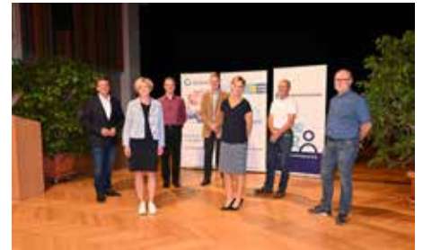
September 2020 Gründung Primärversorgungsnetzwerk