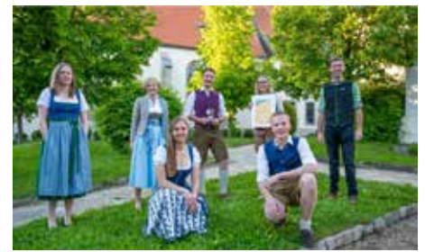
Mai 2021 Projektmarathon „Garten- oase“ Silber Auszeichnung