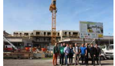
Mai 2023 Gleichener Neues Ortszentrum