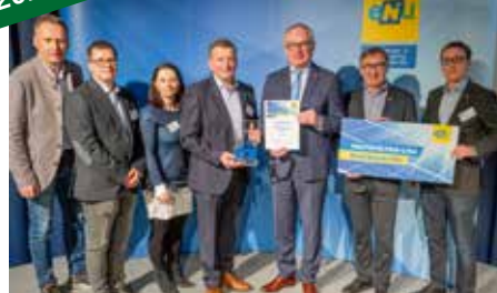
Februar 2023 Hürm ist Bezirks- meister PV Liga