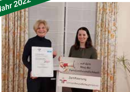
Jänner 2022 Familienfreundliche Gemeinde