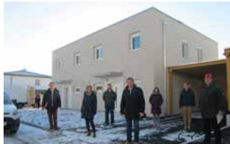
Februar 2021 Schlüsselübergabe GEDESAG Reihenhäuser