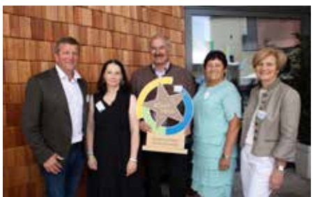
Juni 2024 Dorfeld Auszeichnung