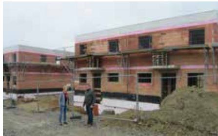
September 2020 GEDESAG Errichtung Doppelwohnhäuser Weichselfeldgasse