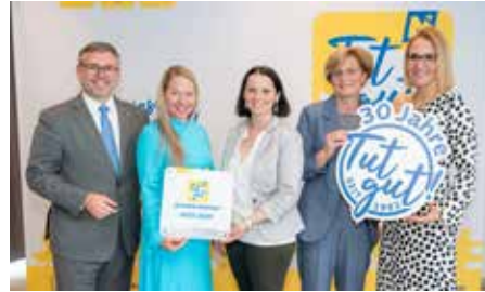
Mai 2023 Gesunde Gemeinde Zertifizierung