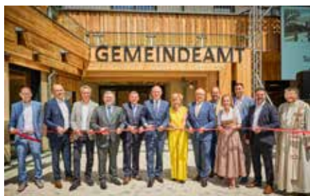
Juli 2024 Eröffnung Neues Ortszentrum