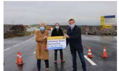
November 2020 Eröffnung Umfah- rung L 5246