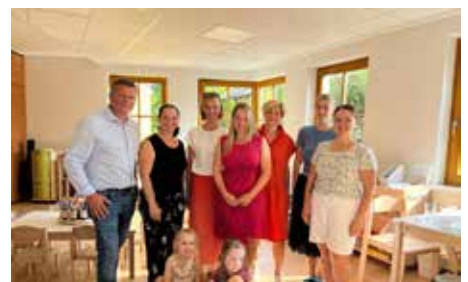
September 2024 Start Kindergartenprovisorium