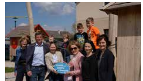
April 2023 Spielplatz Eröffnung Weichselfeldgasse