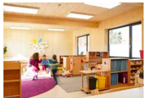
Jänner 2022 Start neues Kindergartenprovisorium