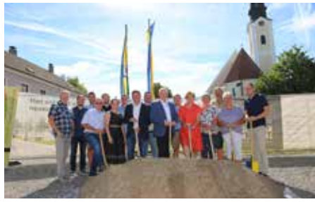
Juli 2022 Spatenstich Neues Ortszentrum