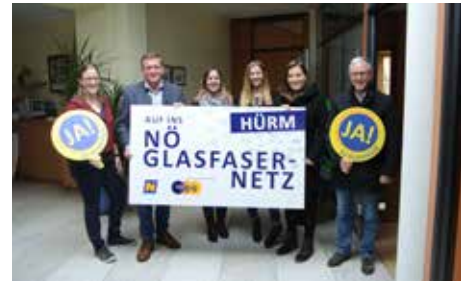
Oktober 2022 Glasfaser Quote erreicht