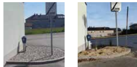
alt / neu

In diesem Sinne wünschen wir allen Hürmer/innen frohe Weihnachten und einen schönen Start ins neue Jahr 2026.