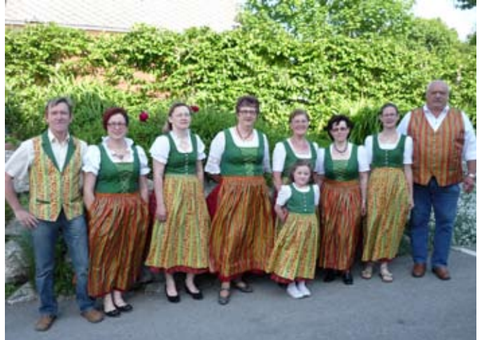
Seit 2014 erhältlich: das Hürmer-Dirndl, als Festtags- oder Alltagstracht