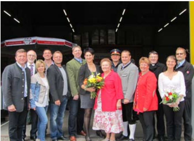
Am 9. Mai 2014 wurde mit zahlreichen Ehrengästen der Getränkehandel Haberl im Betriebsgebiet eröffnet.