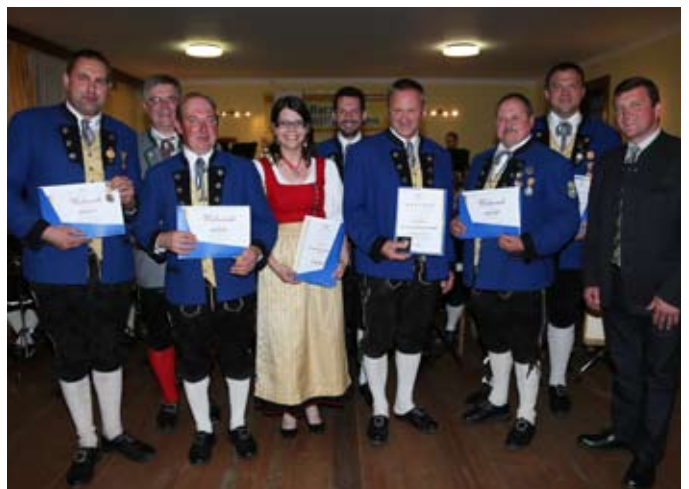
Das musikalische Engagement der Musiker wurde beim diesjährigen Frühlingskonzert mit div. Ehrungen gewürdigt!