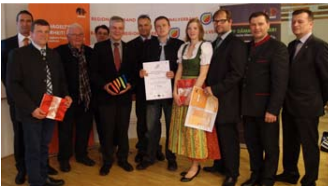
Beim Fassadenwettbewerb des Regionalen Entwicklungsverbandes NÖ erreichte die Fassade des neu errichteten Wohnhauses der Fam. Kurz den 2. Platz. Ein besonderes Augenmerk wurde heuer auf energieeffizientes Bauen und Sanieren gelegt.